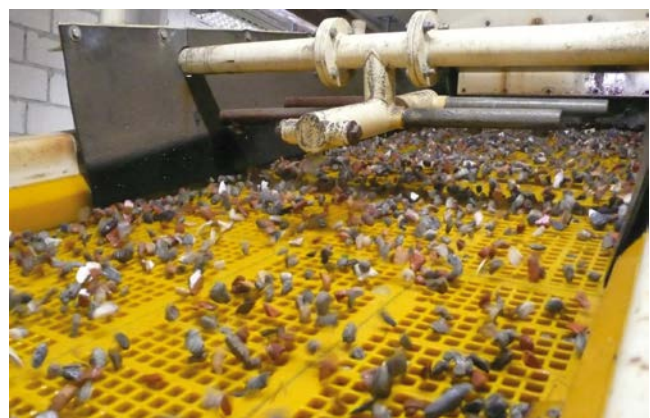
Nassaufbereitung von Mischabbruchgranulat im Kieswerk