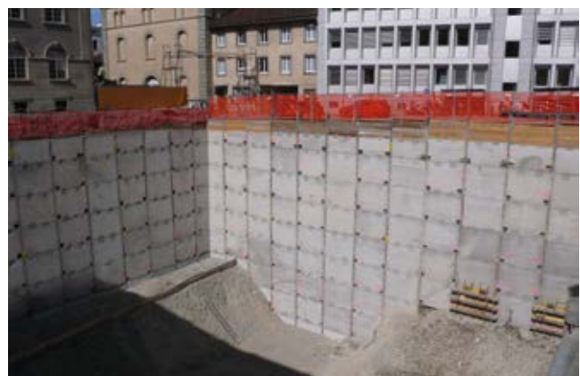
Baugrubensicherung aus Recycling SCC-Beton (Neubau Bündner Kunstmuseum, Chur)