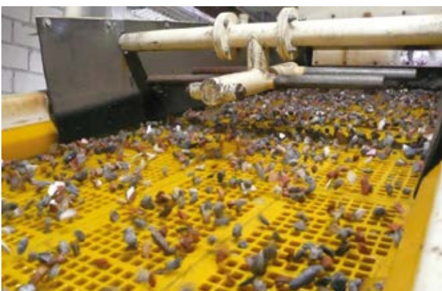
Aufbereitung von Mischabbruchgranulat im Kieswerk