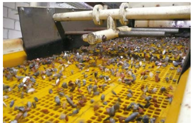
Nassaufbereitung von Mischabbruchgranulat im Kieswerk